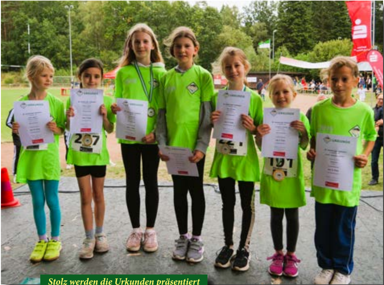
Stolz werden die Urkunden präsentiert