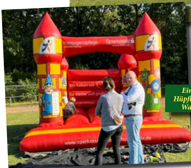
Ein Rugby-Spieler an der Hüpfburg und – mit Krawatte. Was hat das zu bedeuten?