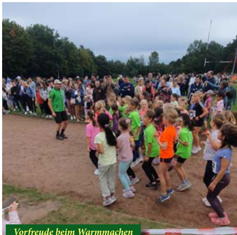
Vorfreude beim Warmmachen vor den Lauf der Kinder ...