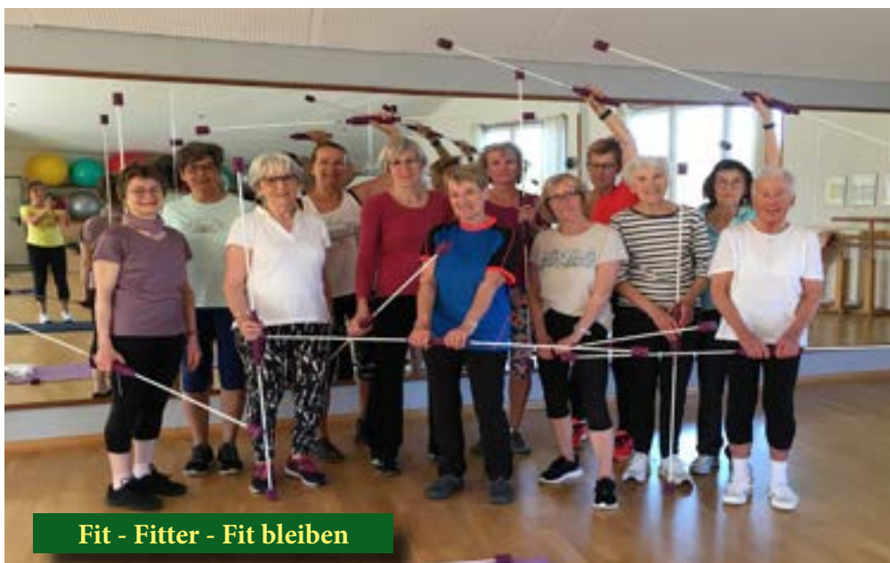
Fit - Fitter - Fit bleiben

Und neben der körperlichen Fitness haben wir noch etwas zu bieten: Die Geselligkeit kommt bei uns auch nicht zu kurz.