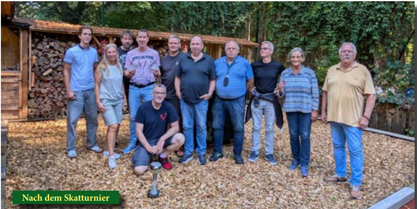
Nach dem Skatturnier

eine Radtour und – zur Krönung der Geselligkeit – ein ordentliches Boßeln. Da wurde nicht nur geworfen, sondern auch herzlich gelacht.