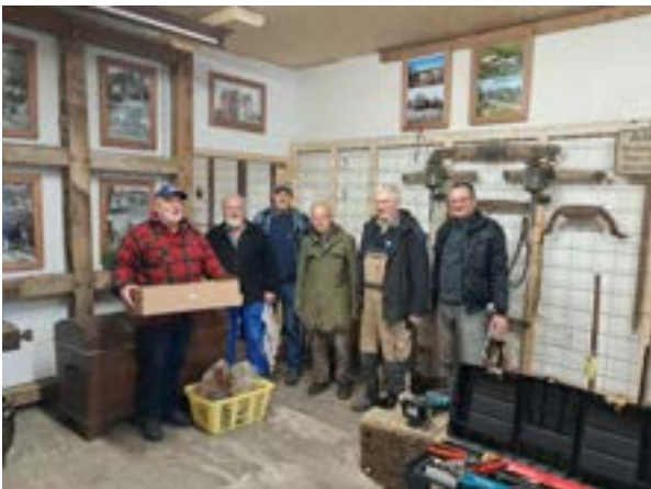
In der Museumsscheune am Lohof