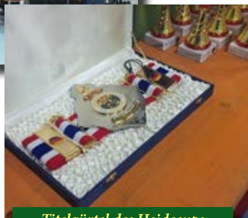
Titelgürtel des Heidecups