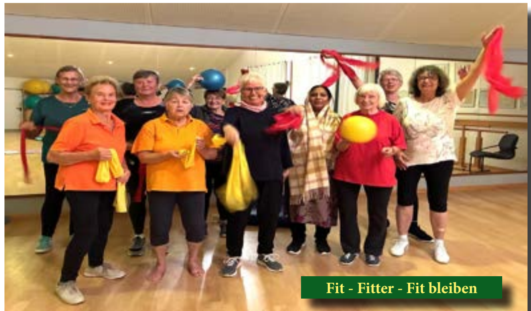
Fit - Fitter - Fit bleiben

Kann dein Selbstbewusstsein noch einen Verstärker gebrauchen?