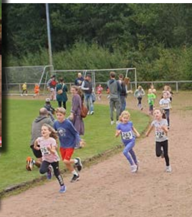
und ihre letzten Meter vor dem Ziel