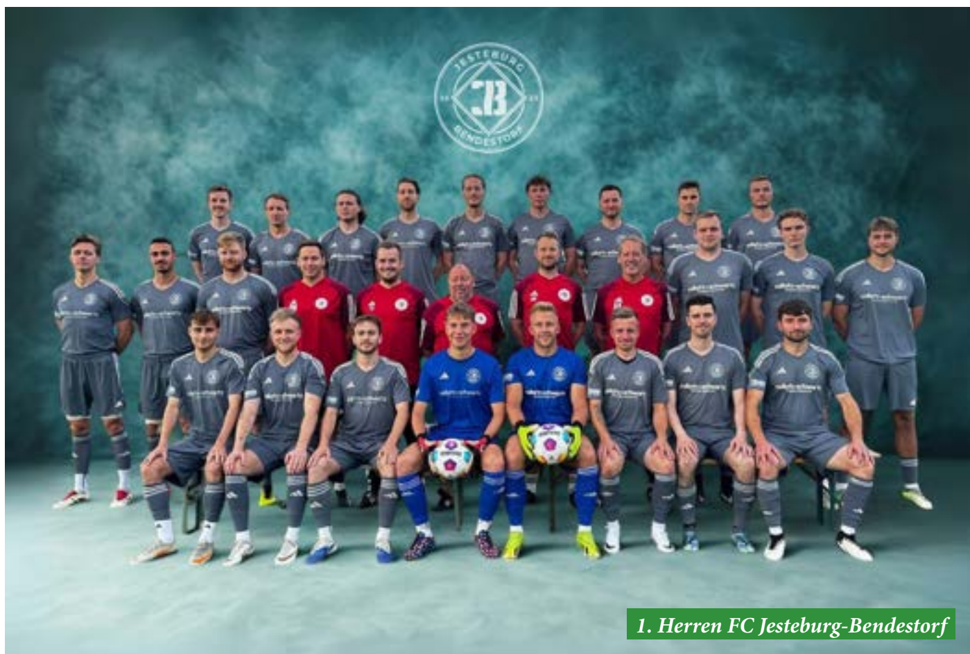
1. Herren FC Jesteburg-Bendestorf