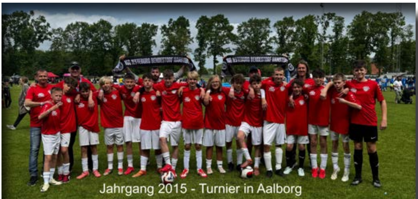
Jahrgang 2015 - Turnier in Aalborg