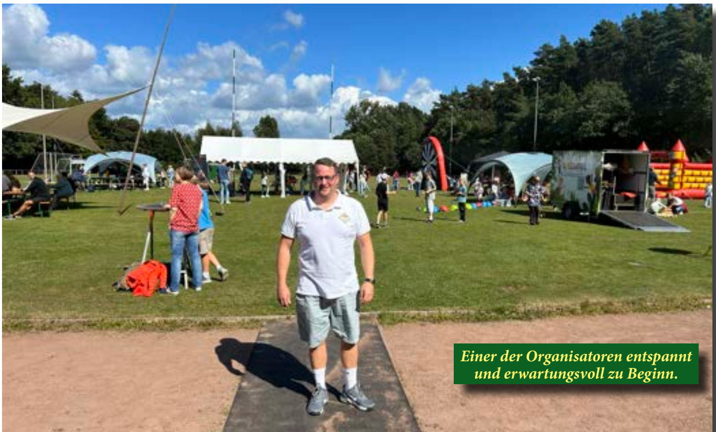
Einer der Organisatoren entspannt und erwartungsvoll zu Beginn.