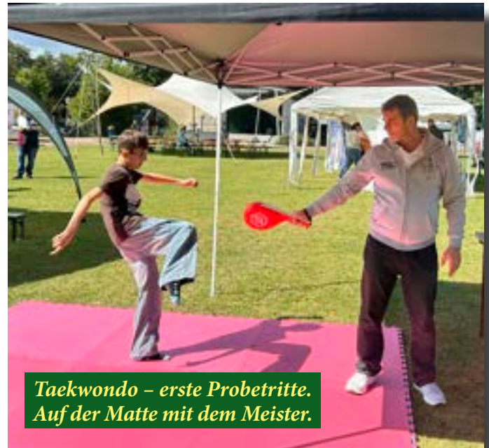
Taekwondo – erste Probetritte. Auf der Matte mit dem Meister.