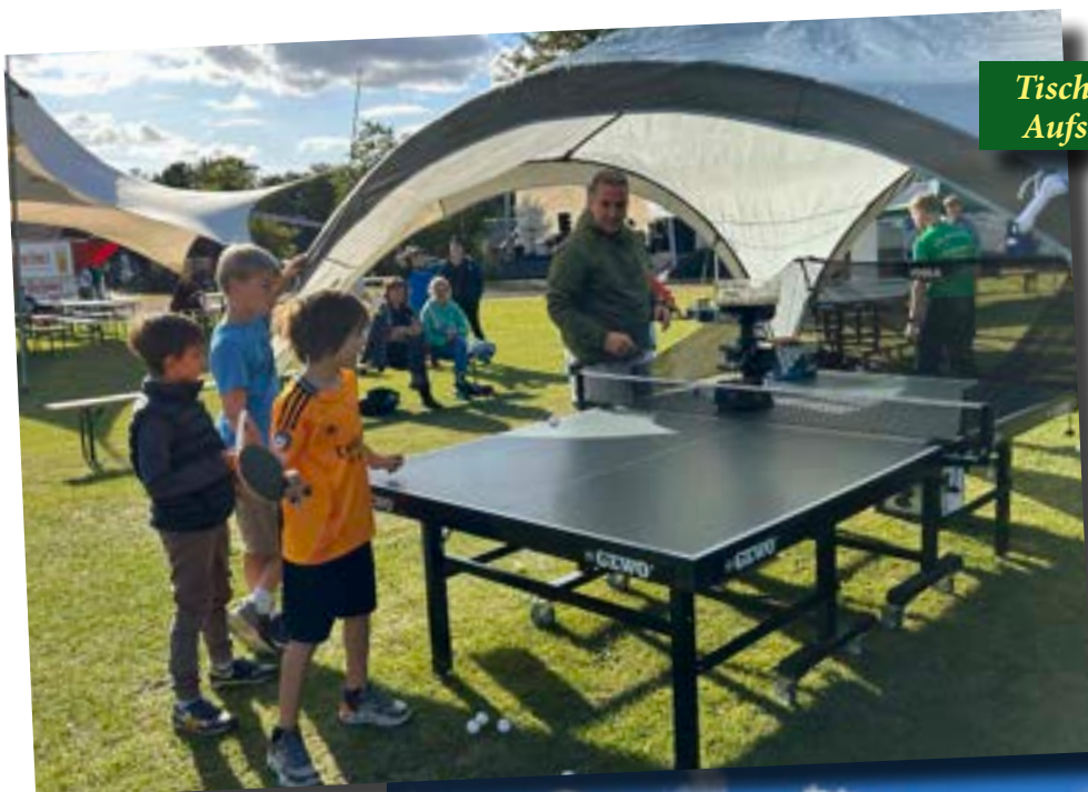
Tischtennis gegen die Aufschlagmaschine.