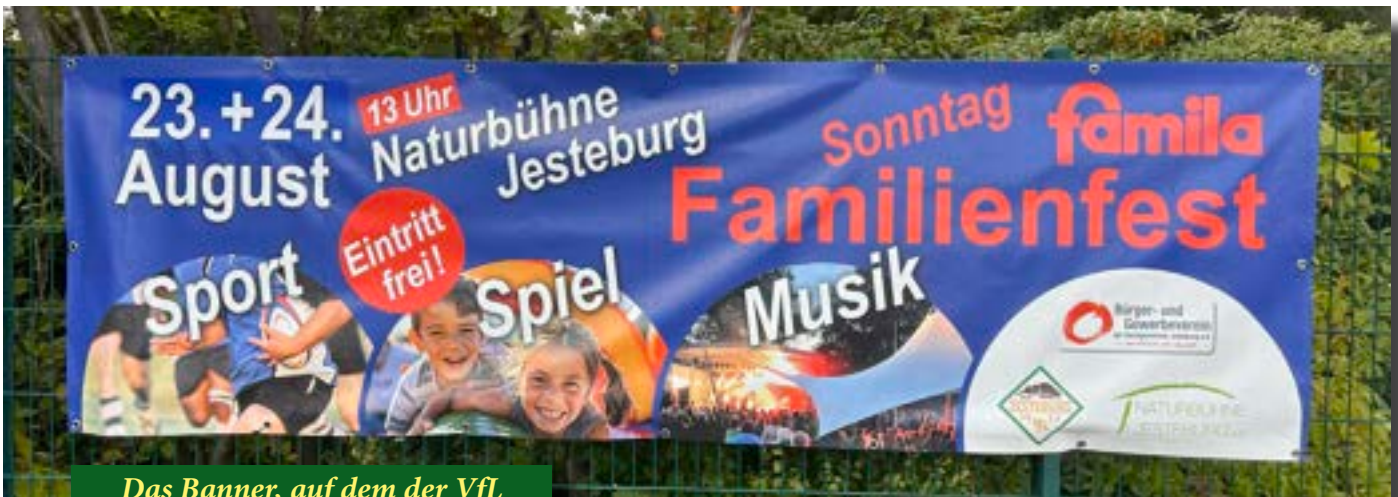
Das Banner, auf dem der VfL sichtbar werden muss.