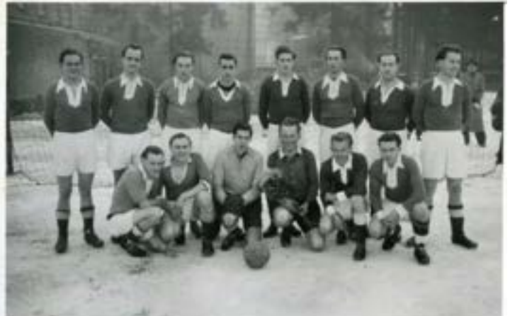
Aus dem Archiv: Fußballmannschaft VfL (Mitte 50er Jahre)