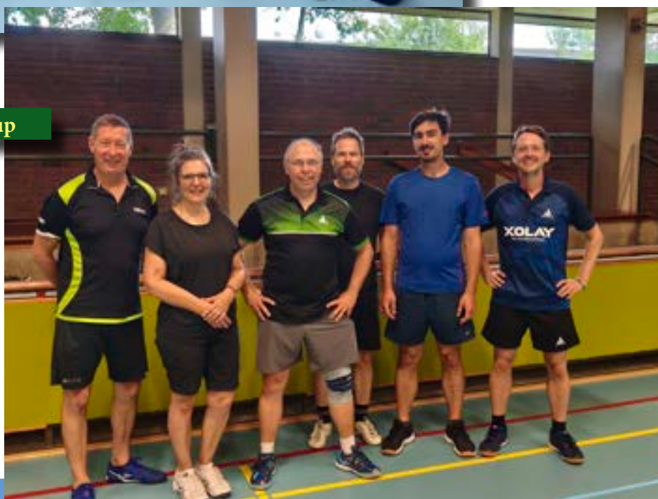
Sommer Team Cup