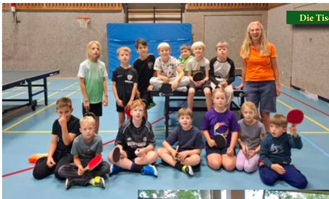
Die Tischtennis Schul AG