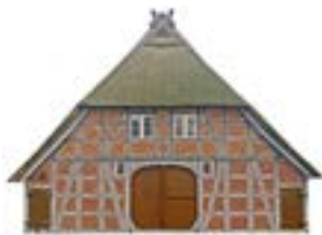
Heimathaus Niedersachsenplatz 5