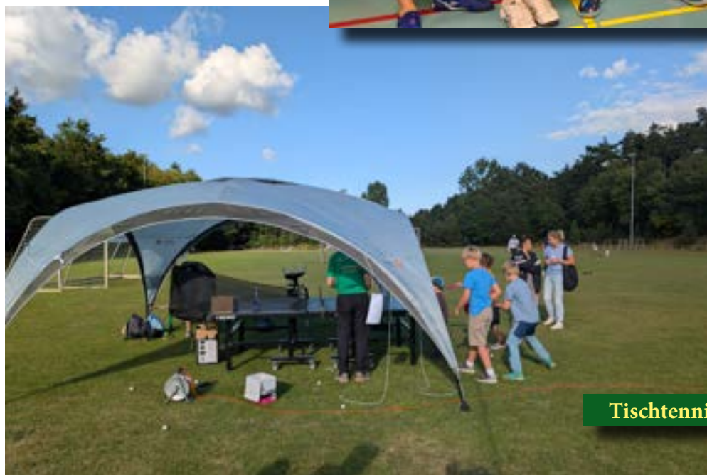
Tischtennis beim VfL-Sommerfest