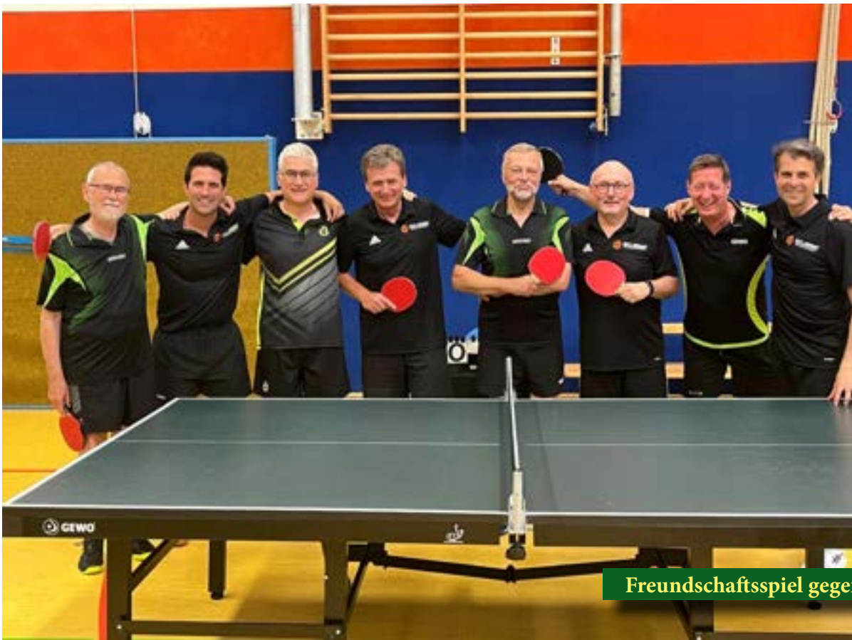
Freundschaftsspiel gegen Kösching